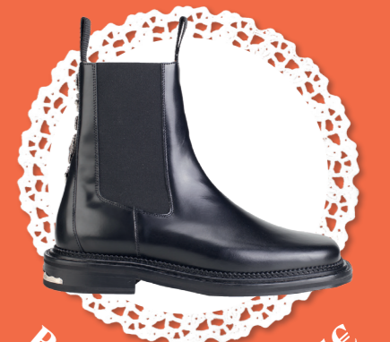
Boots en cuir - 525€