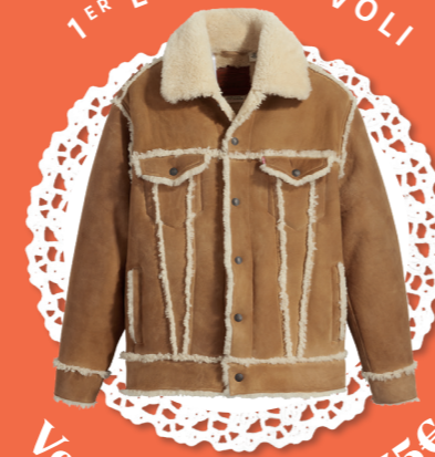
Veste Trucker - 855€