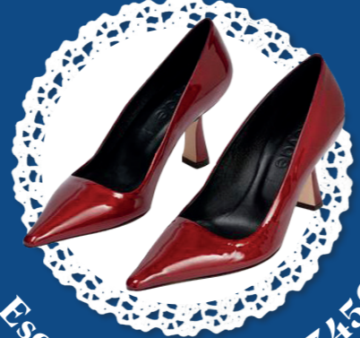
Escarpins Zandra - 345€