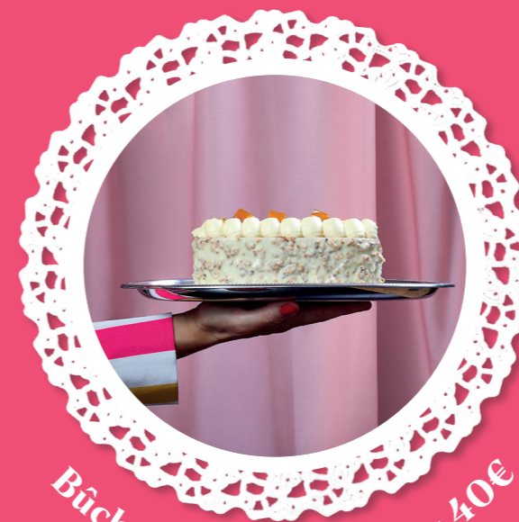
Bûche «Marie-Louise» - 40€