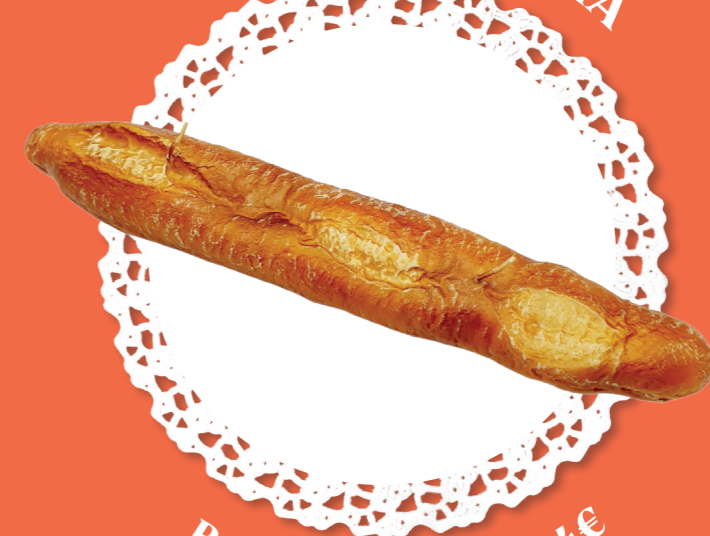
Bougie Baguette - 24€