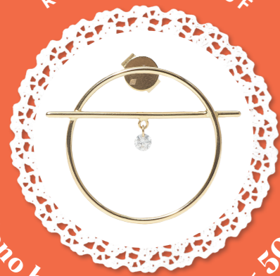
Mono boucle Fibule XS - 500€