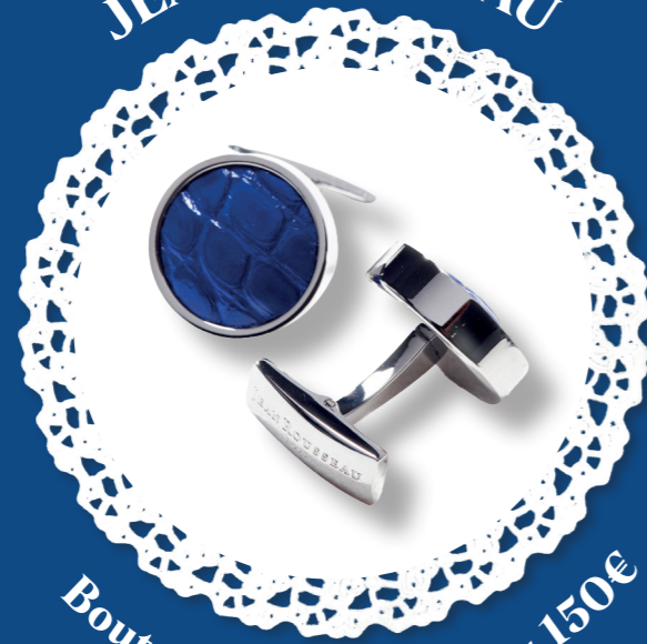
Boutons de manchette - 150€