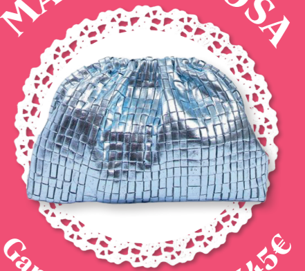
Game Laminated - 345€