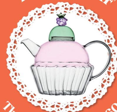
Théière pâtisserie - 60€