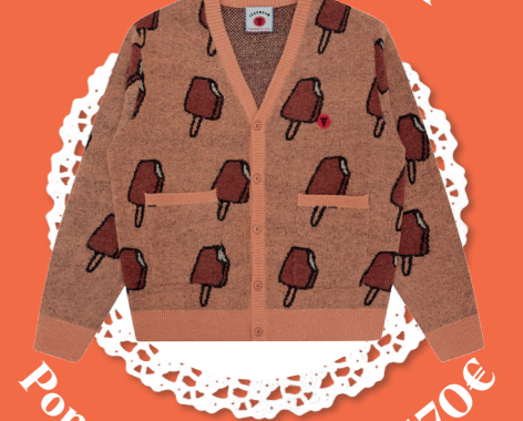
Popsicle cardigan - 170€