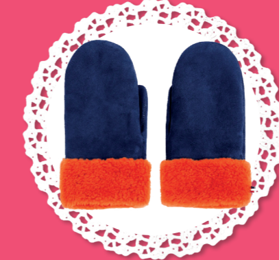
Moufles - 135€