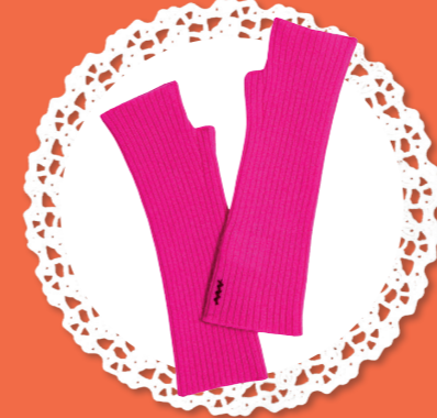
Mitaines - 70€