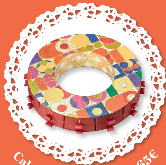
Calendrier de l'Avent - 65€