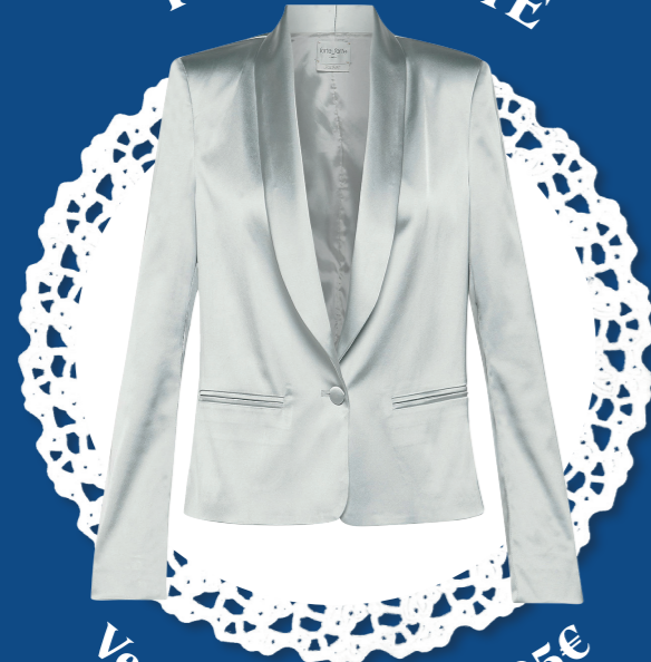
Veste de costume - 595€