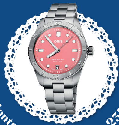
Montre Cotton Candy - 2350€