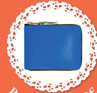
Portefeuille - 190€