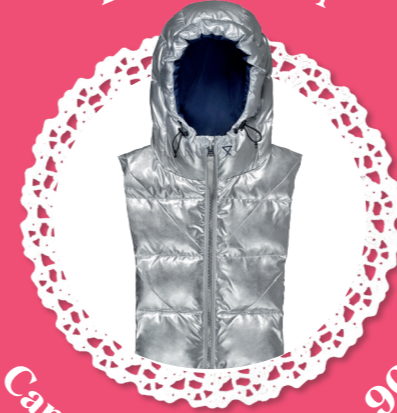
Capuche doudoune - 90€