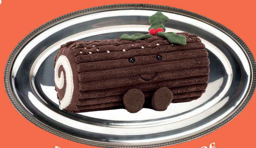
Peluche bûche de Noël - 30€