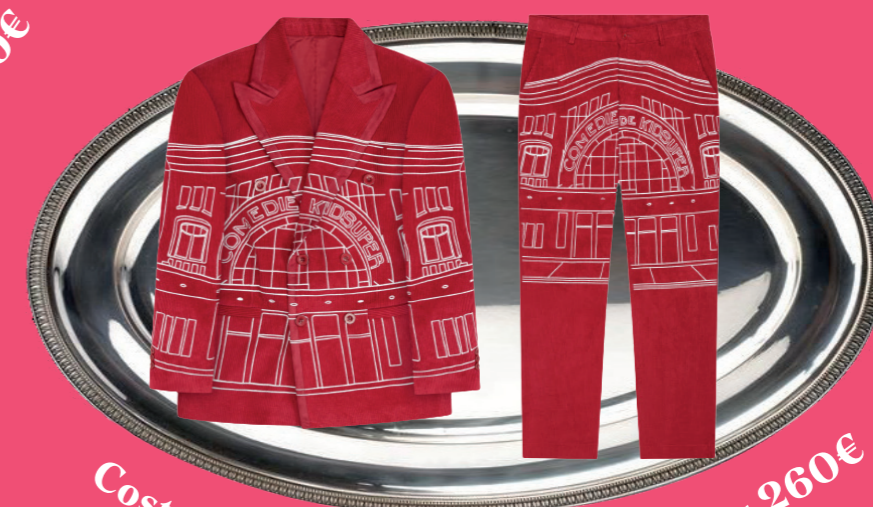
Costume haut - 450€ et pantalon - 260€