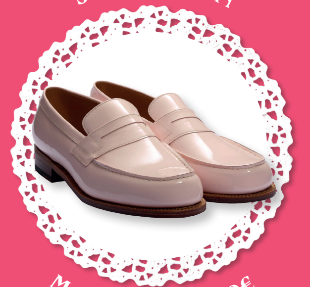
Mocassins 180 - 750€