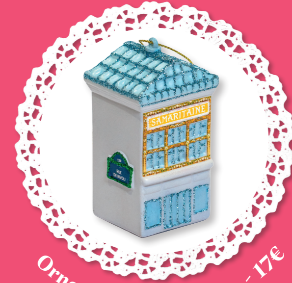
Ornement Samaritaine - 17€