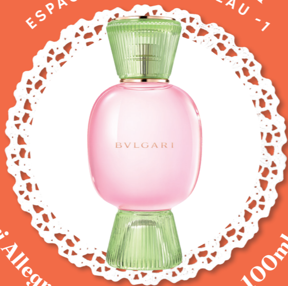
Bvlgari Allegra, Dolce Estasi EDP, 100ml - 220€