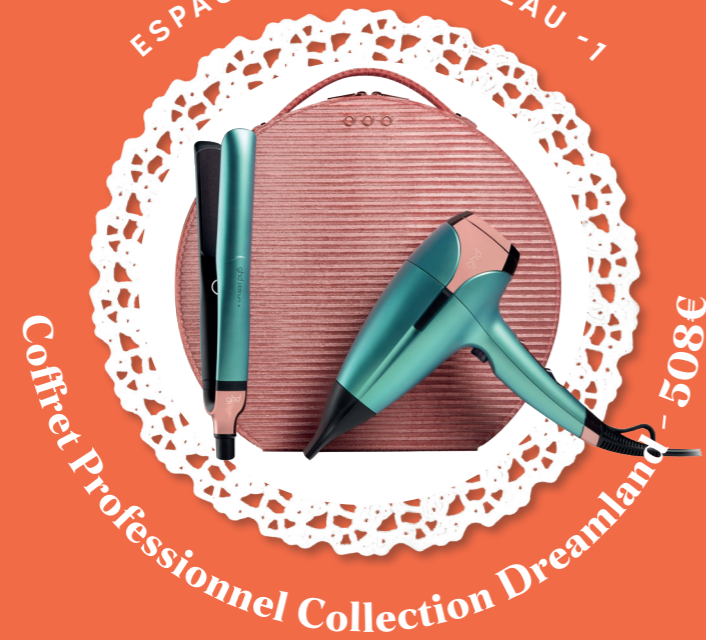
Coffret Professionnel Collection Dreamland - 508€