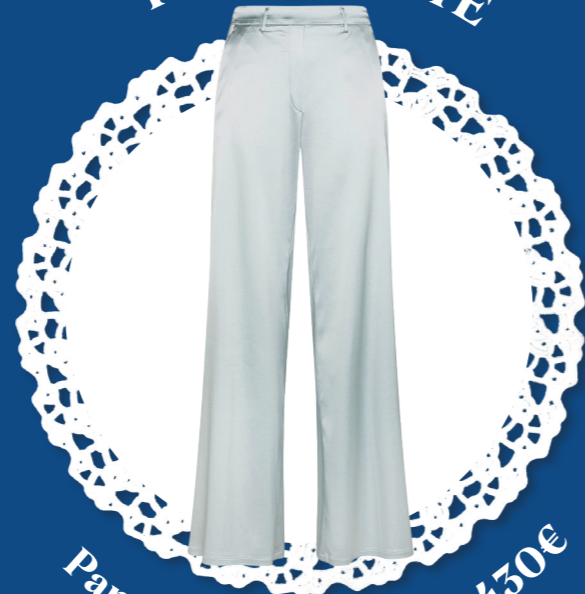
Pantalon de costume - 450€